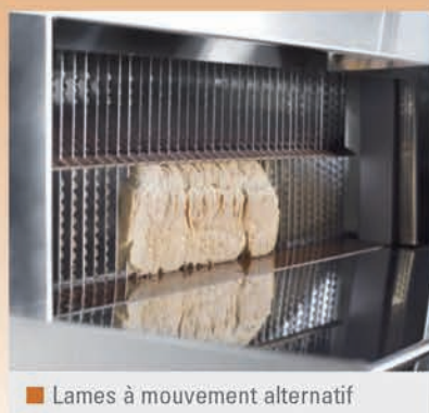
■ Lames à mouvement alternatif