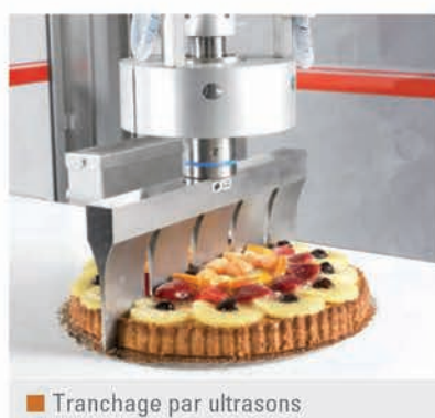
■ Tranchage par ultrasons