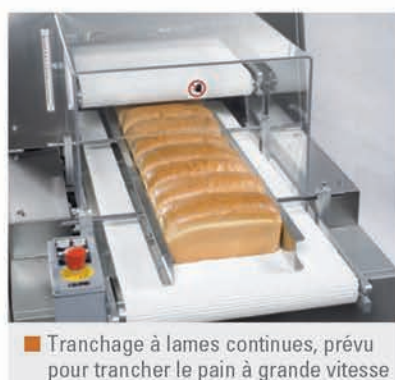
■ Tranchage à lames continues, prévu pour trancher le pain à grande vitesse