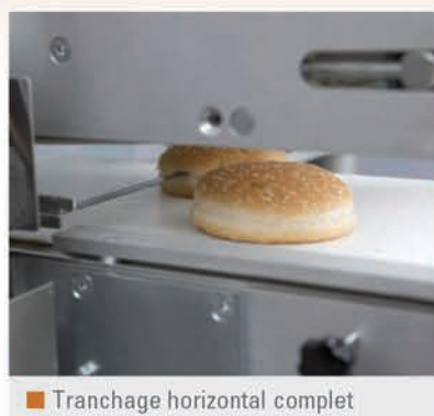
■ Tranchage horizontal complet