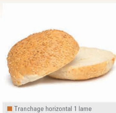
■ Tranchage horizontal 1 lame