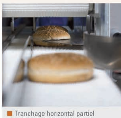
■ Tranchage horizontal partiel