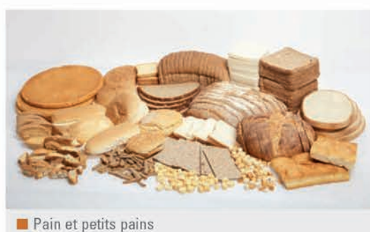
■ Pain et petits pains