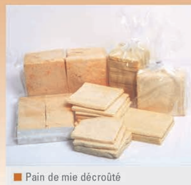
■ Pain de mie décroûté