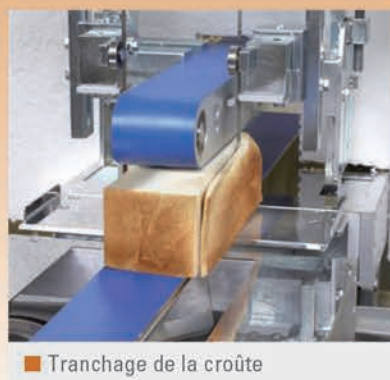
■ Tranchage de la croûte