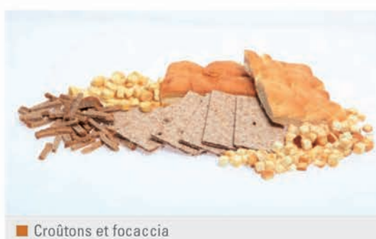
■ Croûtons et focaccia