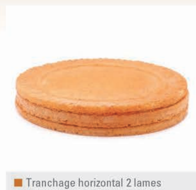
■ Tranchage horizontal 2 lames