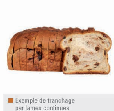
■ Exemple de tranchage par lames continues