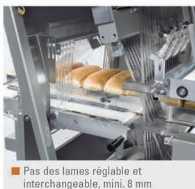
■ Pas des lames réglable et interchangeable, mini. 8 mm