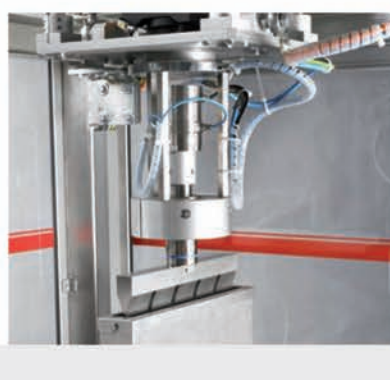
■ Exemple de tranchage par ultrasons