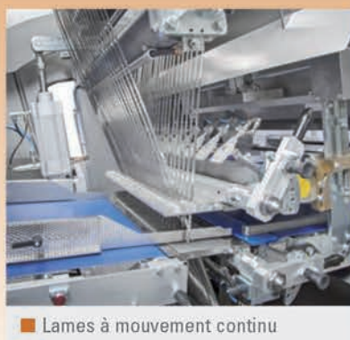
■ Lames à mouvement continu