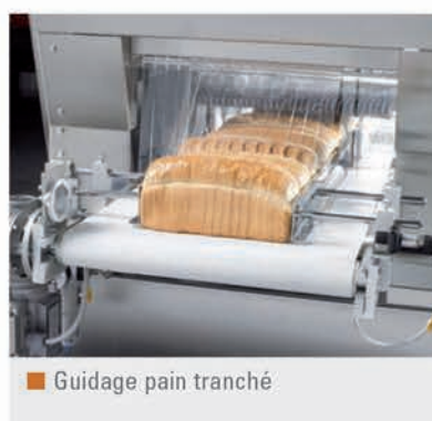
■ Guidage pain tranché